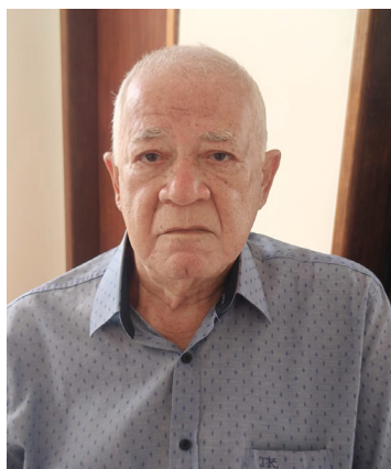
Amilton: "o início de uma nova maneira de se relacionar"

Para atender antiga demanda das áreas regionais, a Real Grandeza deu o pontapé inicial no projeto Ouvidoria e Atendimento Itinerantes, tendo como ponto de partida a cidade de Campos dos Goytacazes, a 270 km da sede, no Rio de Janeiro.