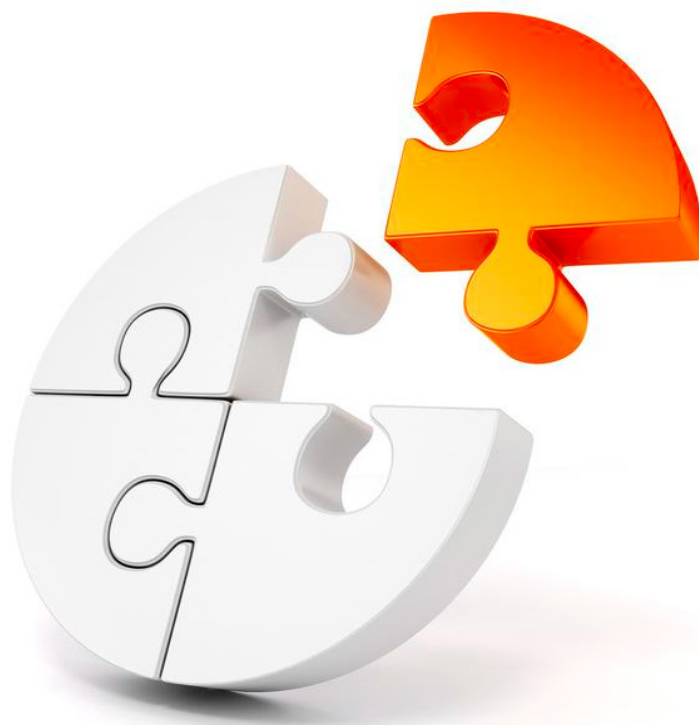
TABELA COPARTICIPAÇÃO HOSPITALAR

Coparticipação hospitalar: conforme tabela ao lado: